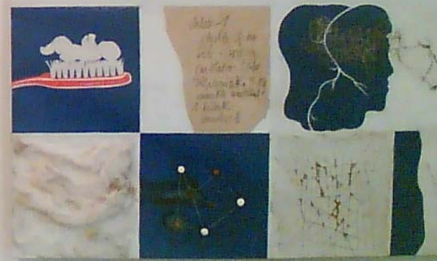
„Jeden dzień w życiu kobiety”, Leszek Sobocki, lata 70. XX w., Muzeum Sztuki Współczesnej w Radomiu