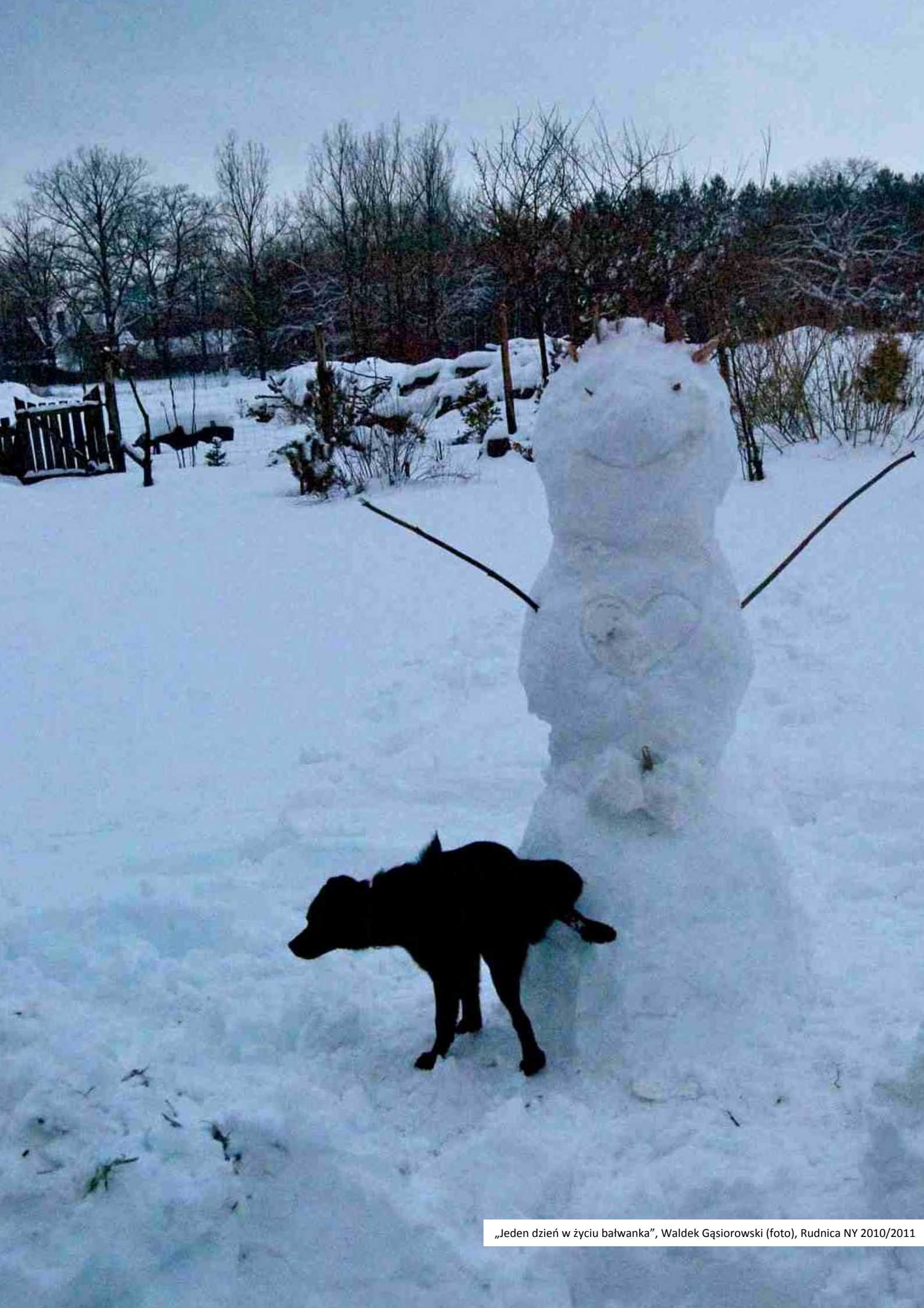
„Jeden dzień w życiu bałwanka”, Rudnica NY 2010/2011