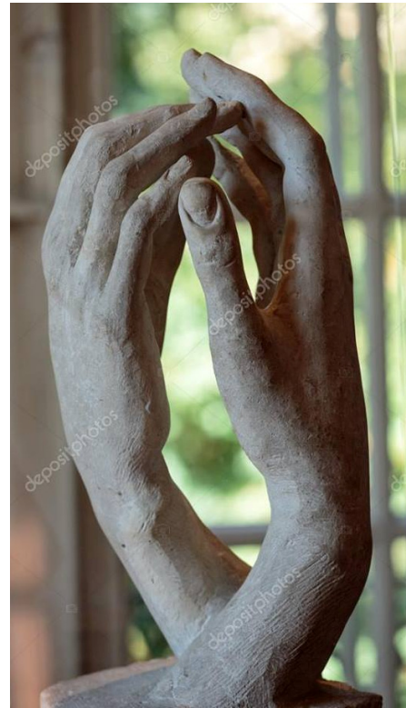
Auguste Rodin, Katedra , 1908

15.04.2019, pożar katedry Notre-Dame w Paryżu