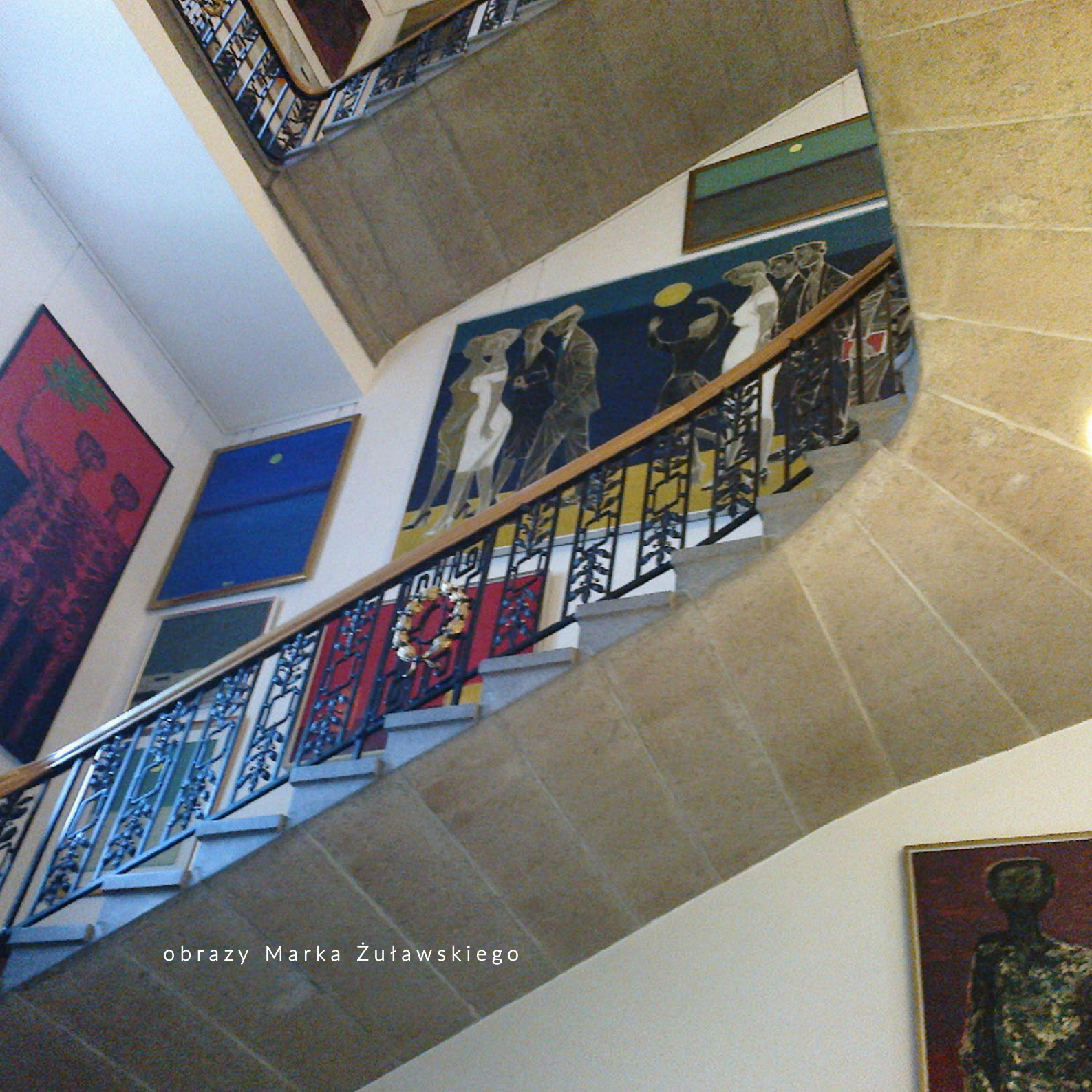
obrazy Marka Żuławskiego