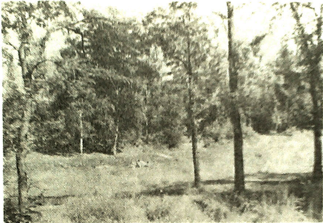
28. Słoneczne polanki w Parku Zdrowia

wyobraźni) leżą niespłoszeni sobą, pauzujący do woli spacerowicze — niemal niewidoczni, sekretni jak szyfry szarodruku.