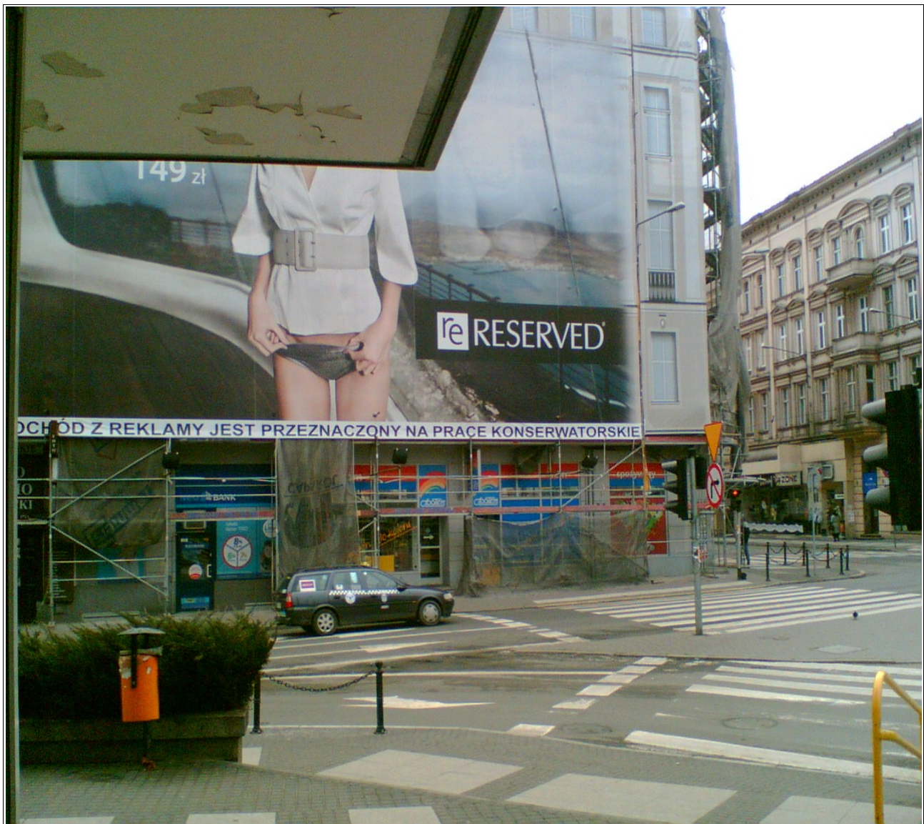
Seks w mieście, Poznań, 17.03.2009