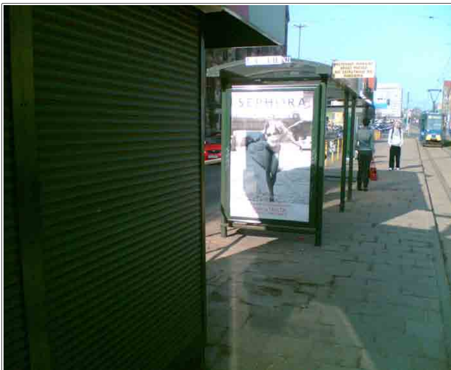
Poznań – centrum w wiosennym słońcu, 6.04.2009

f o t o k o m ó r k i z c y k l u S E K S W M I E Ś C I E