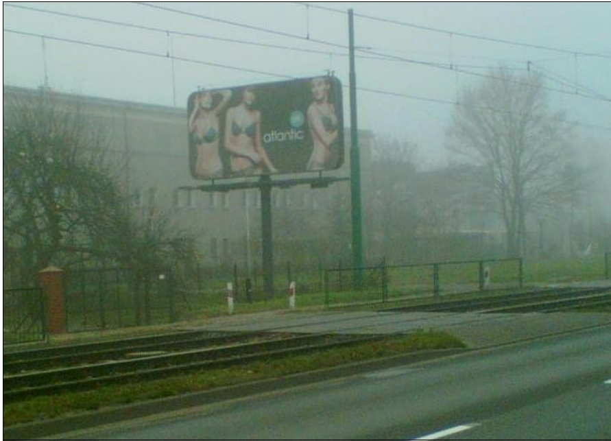
Poznań – obrzeża we mgle, 14.11.2008