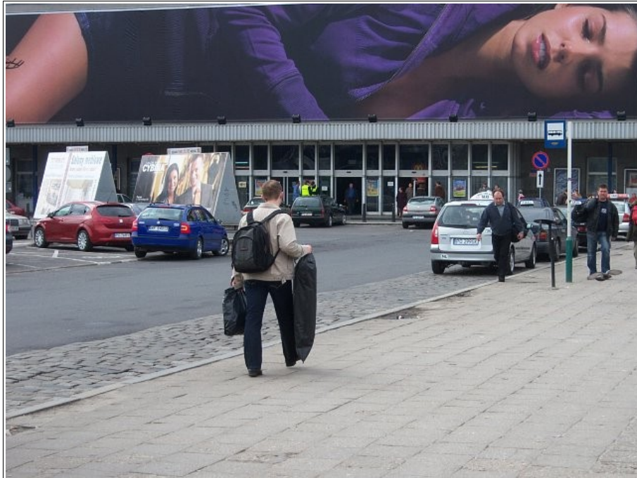
Poznań Główny, 2008, foto: marks