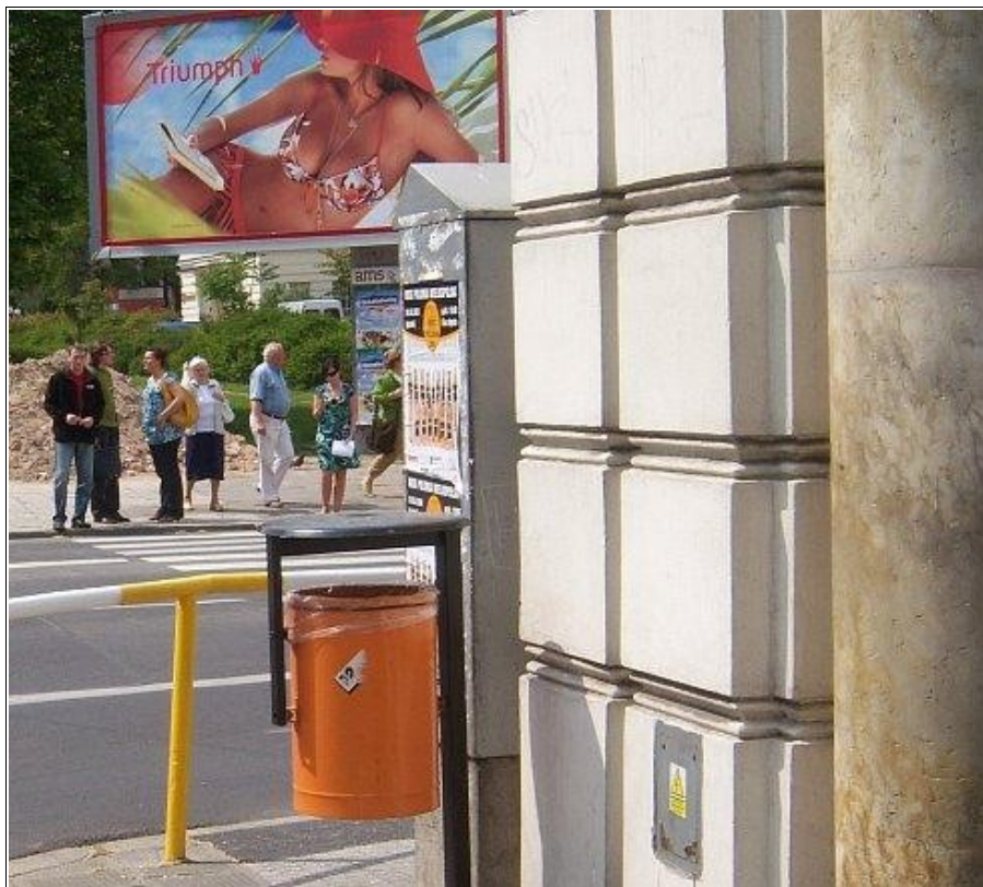
Poznań – w ścisłym centrum, 2008, foto: marks